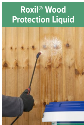
Roxil® Wood Protection Liquid