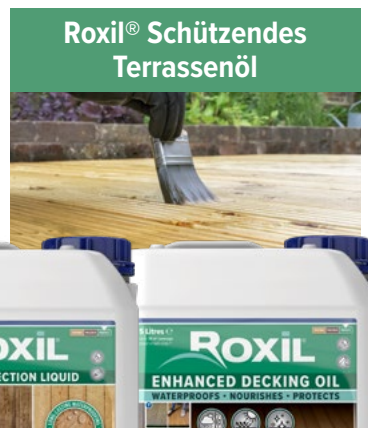
Roxil® Schützendes Terrassenöl

Sobald die Oberfläche trocken ist, kann Sie mit verschiedenen Beschichtungen aus unserer Roxil® Produktreihe geschützt werden.