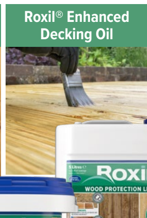
Roxil® Enhanced Decking Oil