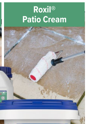
Roxil® Patio Cream

Once dry, the surface can be overcoated with a range of protective Roxil® wood finishes.