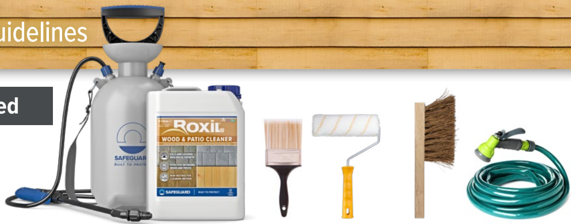
ROXIL® 100 WOOD & PATIO CLEANER WITH 5-LITRE PRESSURE SPRAYER