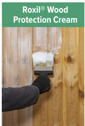
Roxil® Wood Protection Cream

Wash down the surface with water using a stiff brush in combination with a garden hose, then leave to dry.