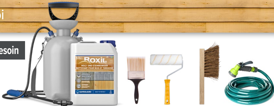
ROXIL® NETTOYANT POUR BOIS ET TERRASSE AVEC SON PULVÉRISATEUR À PRESSION 5-LITRES