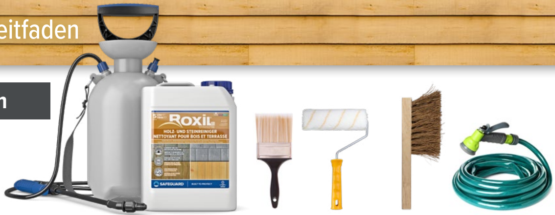
ROXIL® 100 HOLZ- & STEINREINIGER MIT 5 LITER DRUCKSPRÜHGERÄT